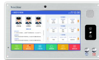
（支持人脸、刷卡识别录入）