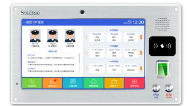
（支持人脸、指纹、刷卡识别录入）